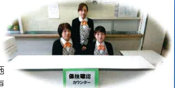
《保険確認カウンター》

変更の際にはご迷惑をおかけしましたが、運用変更にご協力いただきありがとうございます。今後もよりご安心・ご満足いただける病院を目指しますので、よろしくお願いいたします。