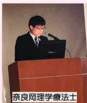
奈良岡理学療法士